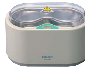
希望小売価格 15,750円(税込)

2つの振動子による超音波の振動で、水中に目に見えない細かい気泡(キャビテーション)が無数に発生します。