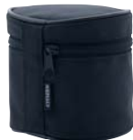
●キャリングケース