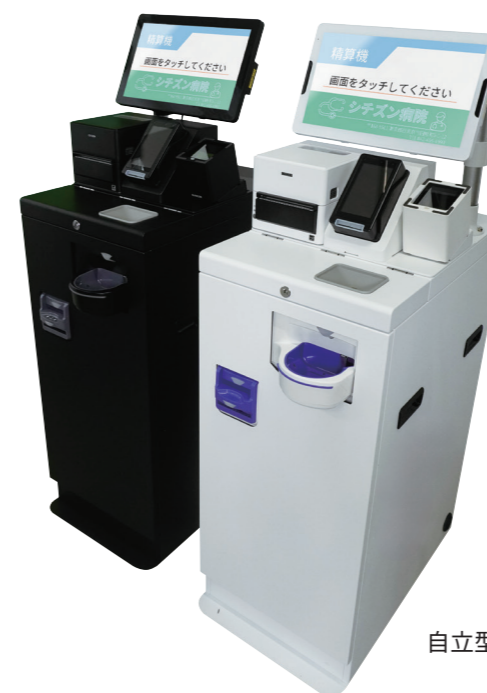
自立型 (スタンド式)