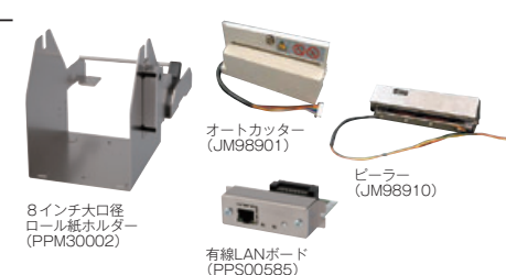
8インチ大口径 ロール紙ホルダー (PPM30002)