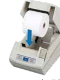
ペーパードロップイン機構