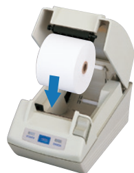
ペーパードロップイン機構