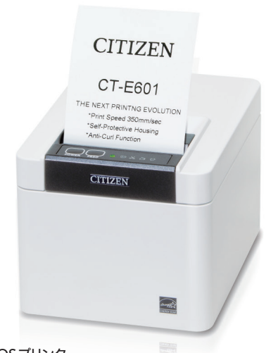
POSプリンター CT-E601 POS Printer CT-E601