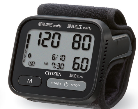
手首式血圧計 CHWHシリーズ Digital Blood Pressure Monitor CHWH Series