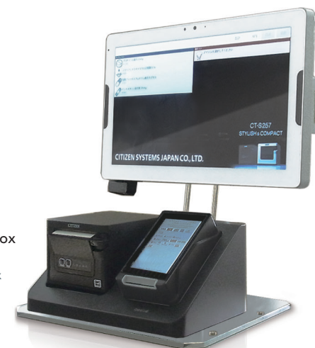
決済BOX CP-B257 Multi-Payment Box CP-B257 Multi-Payment Box

Paper media in a variety of forms – such as tickets, labels and receipts – are indispensable in business today. Citizen Systems designs and supplies state-of-the-art printers tailored to specific business requirements. Our lineup includes built-in printers for POS cash registers and compact measuring equipment, business-use and mobile printers. Our printers are prevalent in shops, factories, hospitals, logistics facilities etc. across the world. We will continue to offer a wide variety of solutions that are based on the concepts of micro and precision technologies, superior reliability, and ease of use.