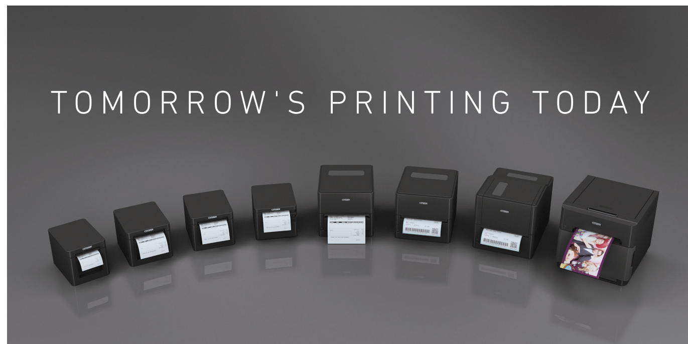
グローバルラインナップ Global Line-up

Paper media in a variety of forms – such as tickets, labels and receipts – are indispensable in business today. Citizen Systems designs and supplies state-of-the-art printers tailored to specific business requirements. Our lineup includes built-in printers for POS cash registers and compact measuring equipment, business-use and mobile printers. Our printers are prevalent in shops, factories, hospitals, logistics facilities etc. across the world. We will continue to offer a wide variety of solutions that are based on the concepts of micro and precision technologies, superior reliability, and ease of use.