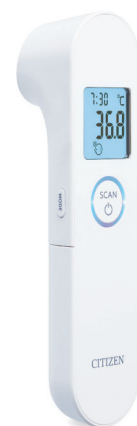
耳/額式体温計 HL710H Digital Forehead and Ear Thermometer HL710H