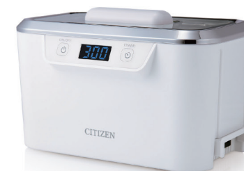
超音波洗浄器 SWT710 Ultrasonic Cleaner SWT710