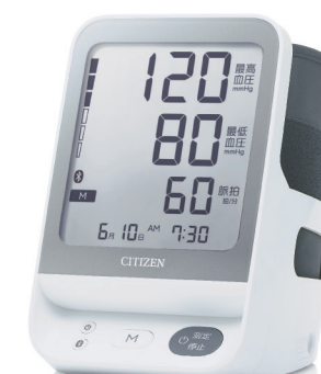
上腕式血圧計 CHUH904C Digital Blood Pressure Monitor CHUH904C

Supporting a healthy lifestyle by enabling at-home healthcare management.