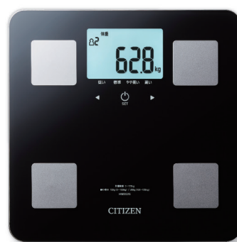
体組成計 HMS525-BK Digital Body Composition Monitor HMS525-BK