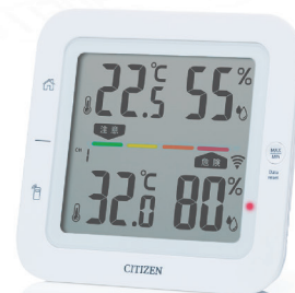
コードレス温湿度計 THM527 Multi-channel Cordless Thermo-hygrometer THM527