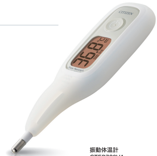
振動体温計 CTEB720VA Digital Thermometer CTEB720VA