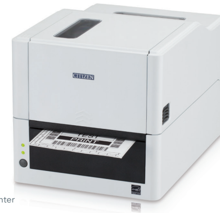
ラベルプリンター CL-E331 Standard Desktop Printer CL-E331