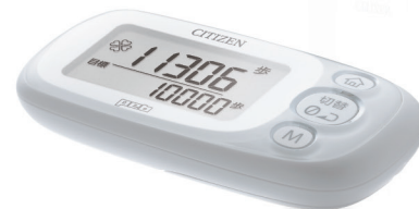
歩数計 TWT512 Pedometer TWT512