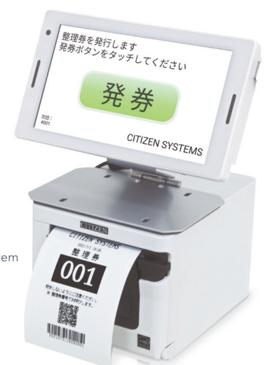
整理券発券機 CQ-S257 Queue Ticketing System CQ-S257