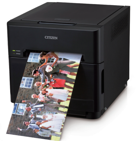
フォトプリンター CZ-01 Photo Printer CZ-01